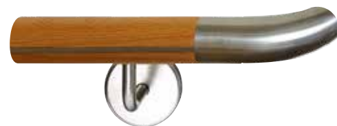
Edelstahl-Endbogen mit mittiger Edelstahl-Einlage