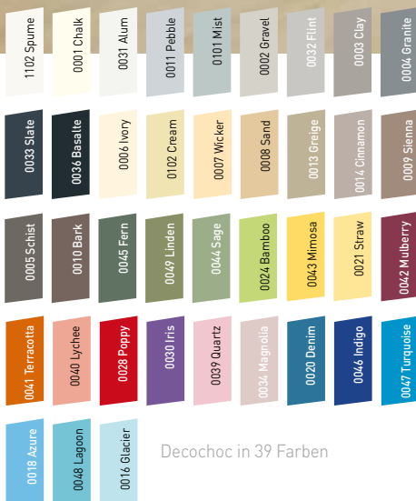
Decochoc in 39 Farben